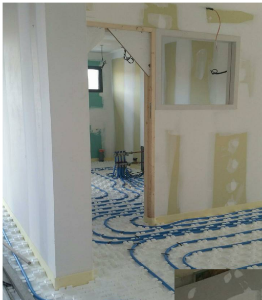
Chauffage au sol

Nous vous rappelons que la crèche dispose d'un agrément pour les enfants de 4 à 6 ans. N'hésitez pas à les contacter au 04 68 74 28 02 pour plus de renseignements.