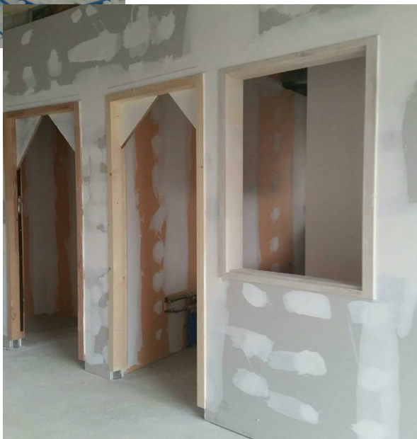
Pose des placos